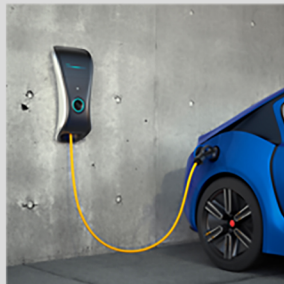
Imágenes orientativas y no reales

Preinstalación de recarga de vehículos eléctricos