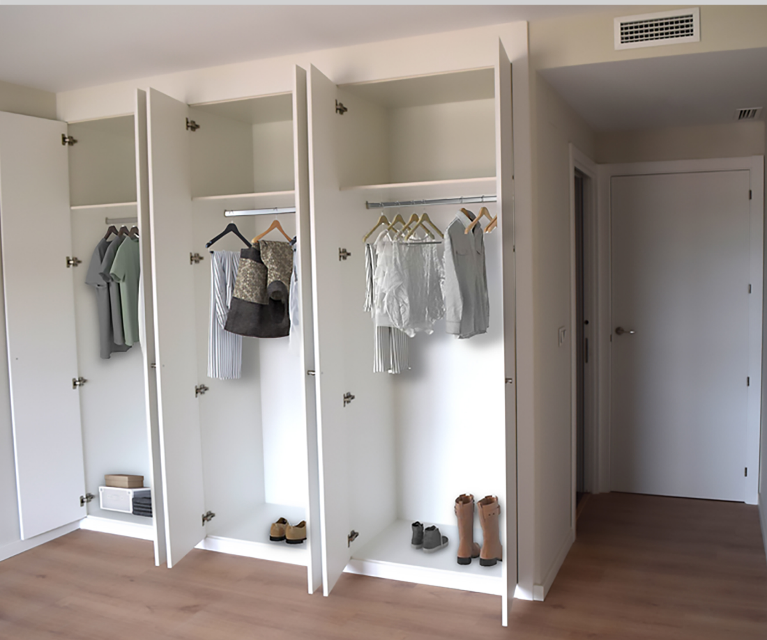
Armarios modulares revestidos con mailetero y barra para colgar